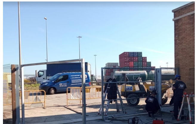
Subministrament i substitució de tanca perimetral galvanitzada