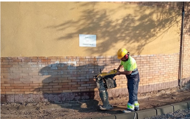
Sanejament i reposició de vorada perimetral