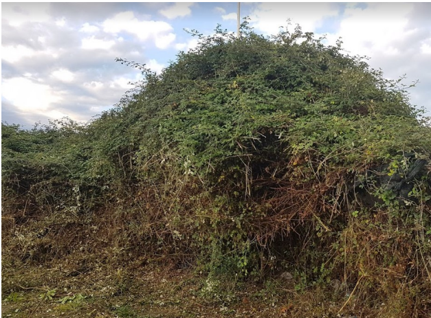
Esbrossada perimetral i refaldat de xiprers