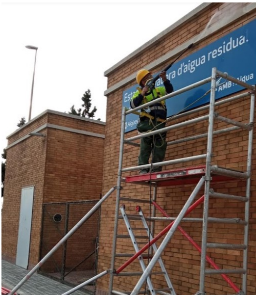
Neteja i protecció del parament vertical