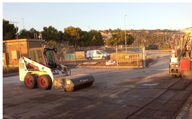
Rehabilitació de asfalt a campa pavimentada